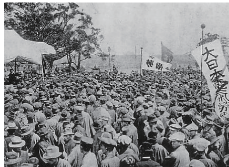
日本の第1回メーデー=1920年5月2日

日本で初めてのメーデーは1920年5月2日。当時は警察による取締りが厳しく、ピラマキや集会をただけで逮捕される時代でした。それでも1万人以上が参加して最低賃金法の制定などを求めました。しかし、1936年の「二・二六事件」の影響で以後の開催は禁止されました。